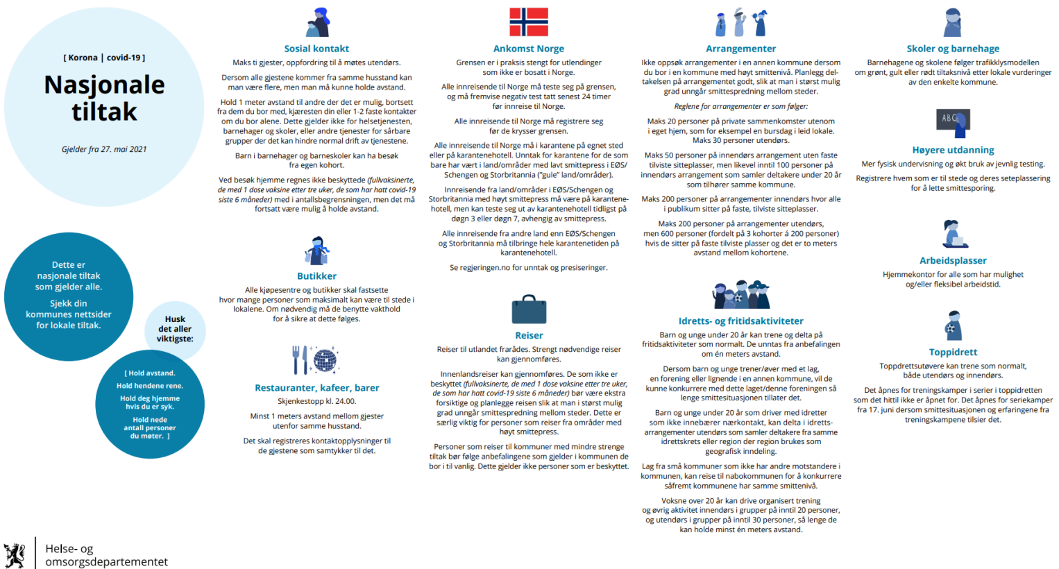
Figur 1: Regjeringens oversikt over nasjonale tiltak