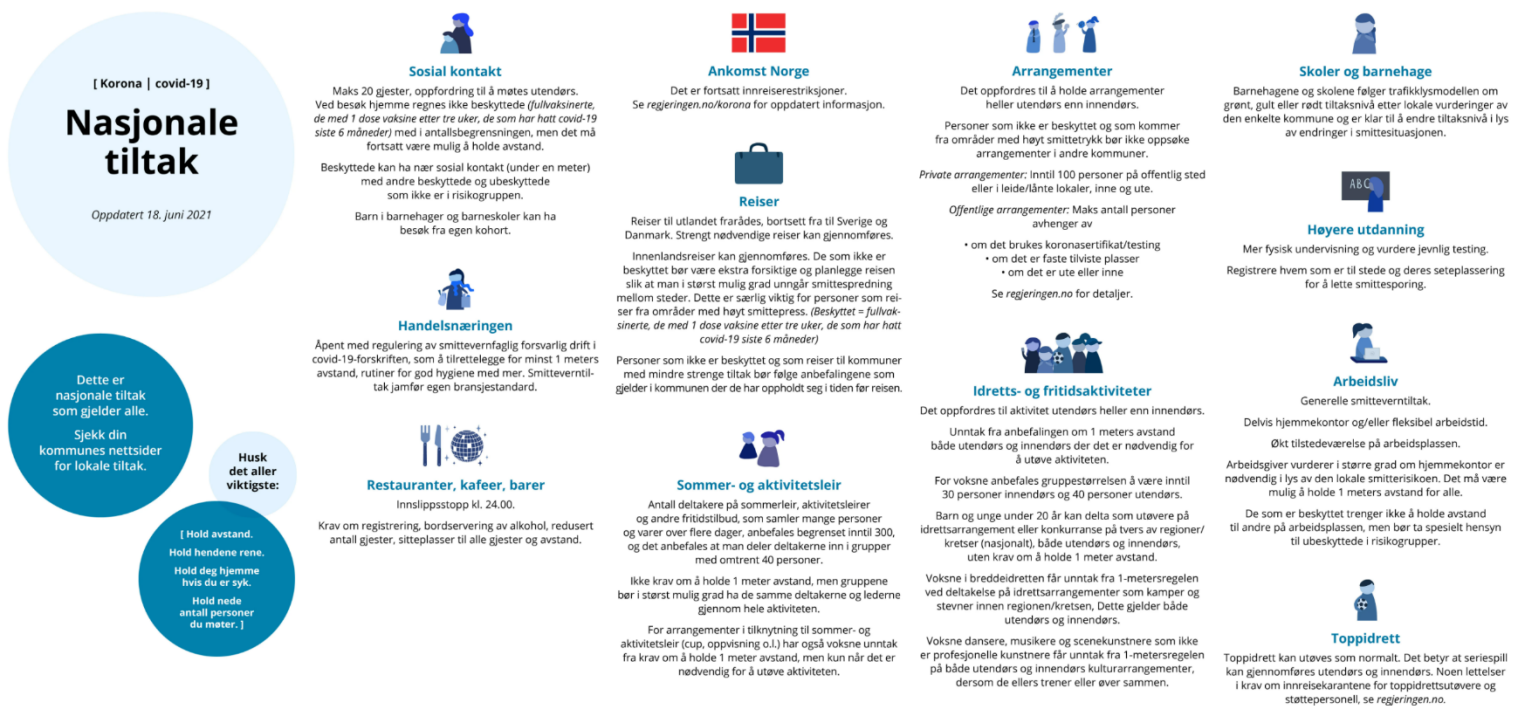
Figur 1: Regjeringens oversikt over nasjonale tiltak