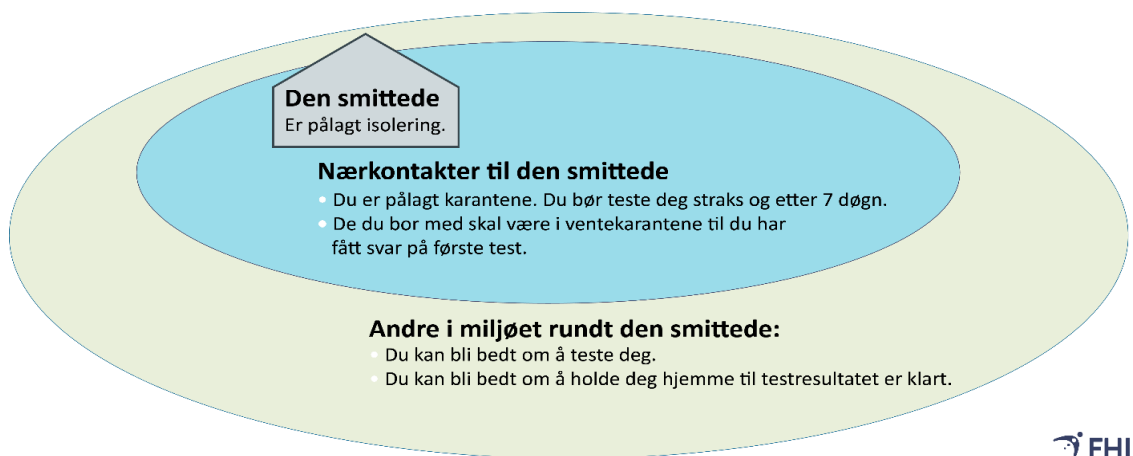
Figur 2: FHIs figur «Forsterket TISK»

Hvis en i husstanden har fått bekreftet covid-19, skal alle i husstanden holdes i karantene. Ansatte i NOAH skal holde seg hjemme dersom man mistenker at noen i samme husstand kan være smittet av koronaviruset. Nærkontakter til personer som får symptomer under karantene, må i karantene i påvente av prøvesvar.