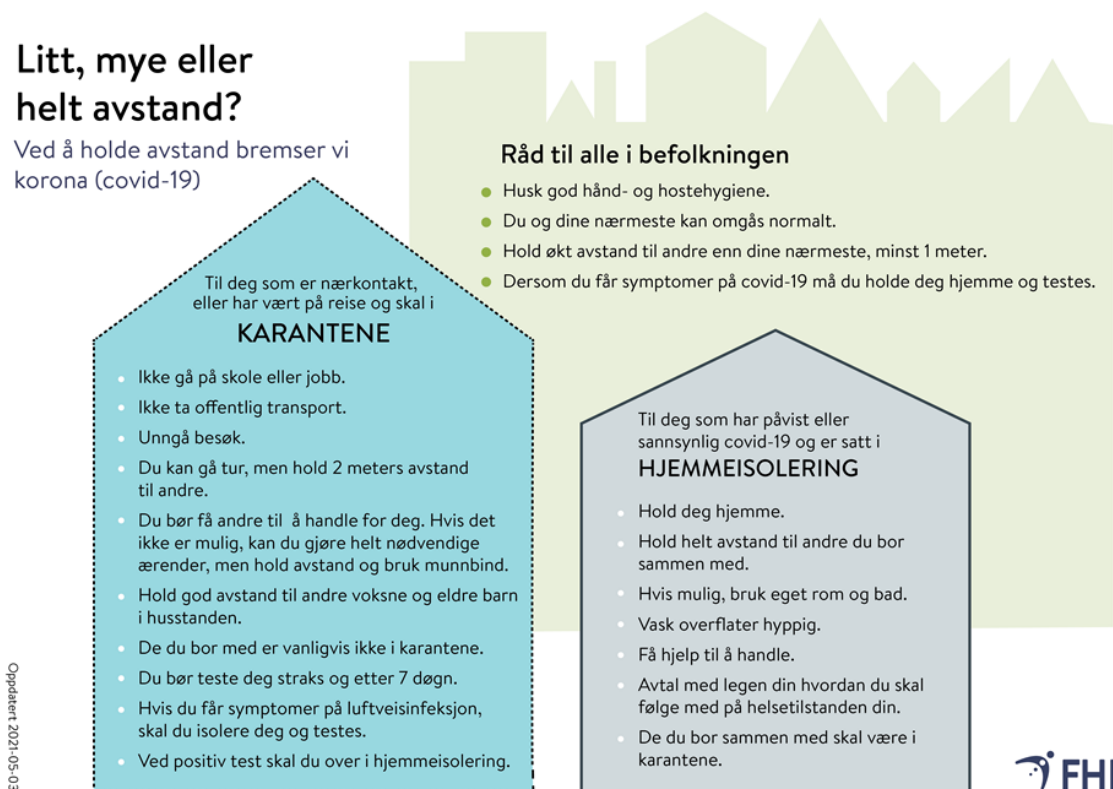
Figur 3: FHIs figur "Litt, mye eller helt avstand"

Ventekarantene gjelder ikke for de som har gjennomgått covid-19 eller som har fått første vaksinedose for mer enn tre uker siden. Unntaket gjelder i seks måneder etter vaksinasjon eller gjennomgått covid-19.