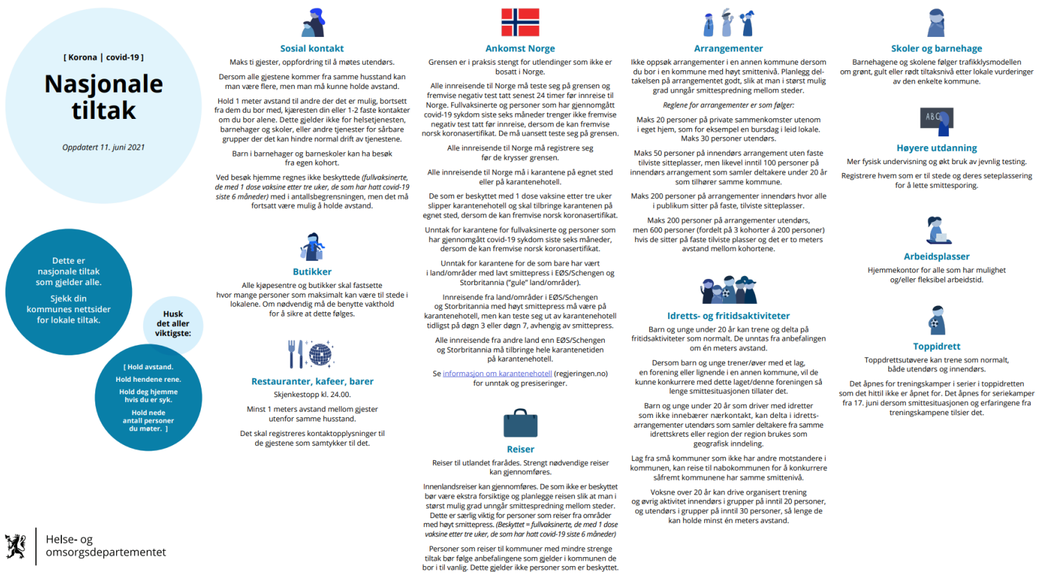
Figur 1: Regjeringens oversikt over nasjonale tiltak