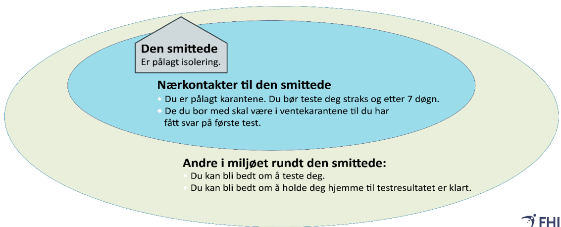
Figur 2: FHIs figur «Forsterket TISK»

Hvis en i husstanden har fått bekreftet covid-19, skal alle i husstanden holdes i karantene. Ansatte i NOAH skal holde seg hjemme dersom man mistenker at noen i samme husstand kan være smittet av koronaviruset. Nærkontakter til personer som får symptomer under karantene, må i karantene i påvente av prøvesvar.