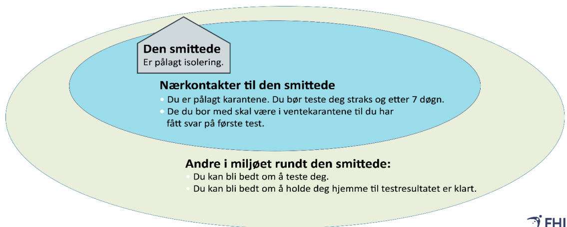
Figur 2: FHIs figur «Forsterket TISK»

Hvis en i husstanden har fått bekreftet covid-19, skal alle i husstanden holdes i karantene. Ansatte i NOAH skal holde seg hjemme dersom man mistenker at noen i samme husstand kan være smittet av koronaviruset. Nærkontakter til personer som får symptomer under karantene, må i karantene i påvente av prøvesvar.