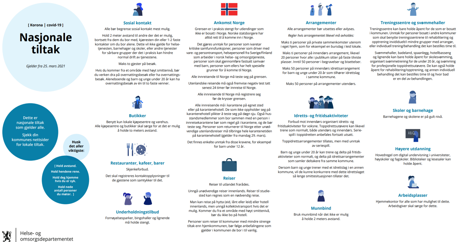
Figur 1: Regjeringens oversikt over nasjonale tiltak