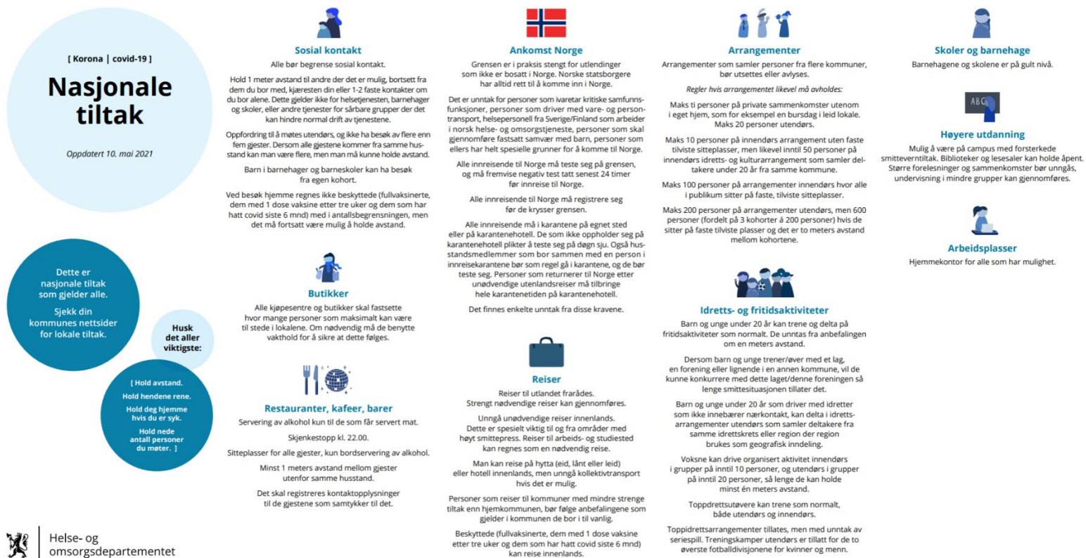
Figur 1: Regjeringens oversikt over nasjonale tiltak